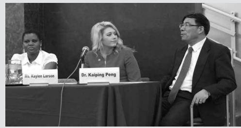
国际幸福日的“中国之声”