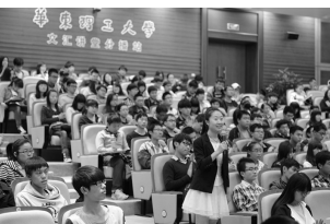
“文学季”也是文汇讲堂送入文讲堂入理工科类高校系列工程的首次尝试，首站选择了华东理工大学。来自华理奉贤分播点的同学们积极提问，踊跃互动，是主会场外另一道亮丽的风景