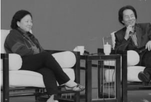
11月8日，“文学季”第二期专场讲座，著名作家、湖北省作协主席方方与刚入选教育部长江特聘学者的复旦大学中文系教授汪涌豪，分别做了《文学创作的个体表达》、《文学：一种否定与超越的力量》的主题演讲