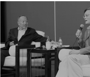
9月13日，前外交部长李肇星做客第79期文汇讲堂，用生动的外交亲历故事阐述《如何讲好中国故事》的主题，并与华东师范大学国际关系与地区发展研究院院长冯绍雷教授共话国际热点