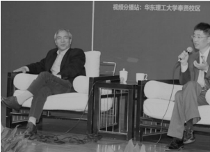
10月25日，“文学季”系列讲座拉开帷幕。著名作家、清华大学中文系教授格非，携手华东师范大学中文系教授、上海市作协副主席杨扬，分别以题为《开放的写作》、《安顿在城市的文学》的演讲，奉上文学饗宴的首道精神大餐