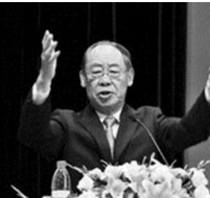
6月15日，台湾地区知名人士、国泰慈善基金会董事长钱复先生在第78期文汇讲堂上，做了《本世纪全球困境：中华传统文化的借镜》的主题演讲，强调“以定制乱，以俭去贪，以爱除恨”