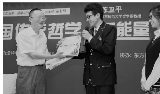
◀华师大一附中“小校友”赠陈卫平学生自编文学杂志

6月21日下午，“东方讲坛·文汇讲堂”哲学演讲季开放论坛作为哲学季七期讲座的“收官总结”在上海社联大楼圆满落幕。上海哲学界十位知名教授围绕着“核心价值与民族复兴”的主题，展开了一场热烈生动的思想讨论。左起为吴晓明、陈学明、高瑞泉、童世骏、冯俊、孙周兴、俞吾金、陈卫平、谢遐龄、孙向晨