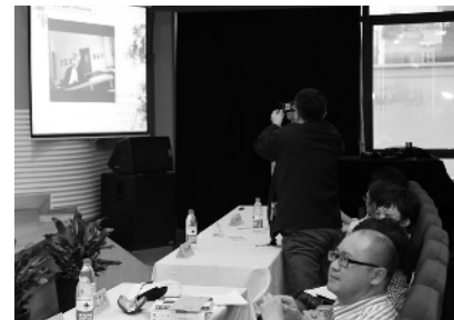
▶童世骏的挪威导师、哲学家希尔贝克在视频中向现场提问