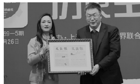
◀30年前文汇报曾报道过俞吾金在复旦的演讲。讲堂赠送今昔两张演讲报道版面